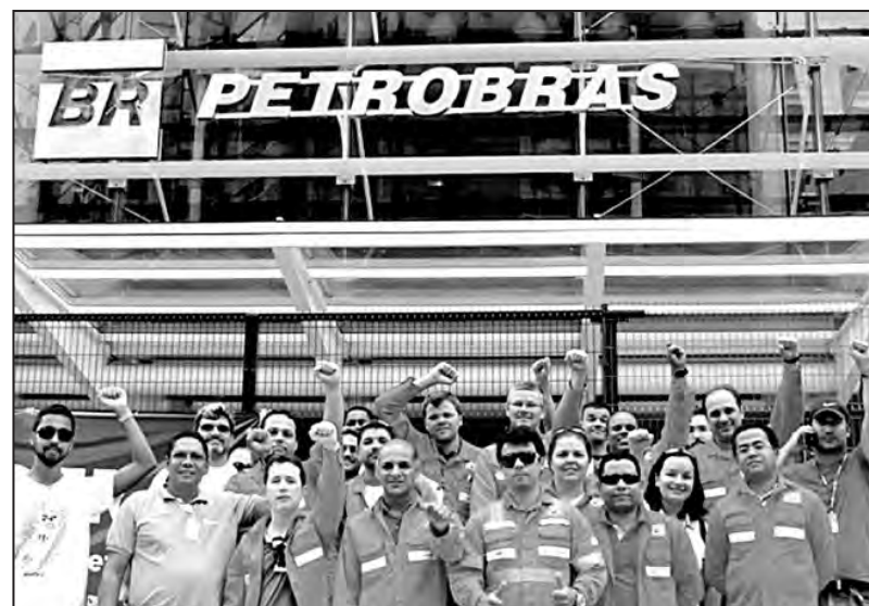
Los trabajadores de Petrobras convocaron a una huelga en defensa de su salario y la seguridad laboral

Desde las grandes movilizaciones populares de 2013, hubo todo tipo de huelgas y reclamos. En los primeros meses de este año los maestros protagonizaron huelgas de más de tres meses y movilizaciones en diferentes Estados. Luego fueron los metalúrgicos de las grandes automotrices quienes lograron frenar parcialmente los despidos. También pararon el correo, las universidades y trabajadores estatales. En este momento están parados desde hace 10 días los obreros de 58 plataformas, refinerías y terminales de Petrobras. Los que frenan las luchas y su