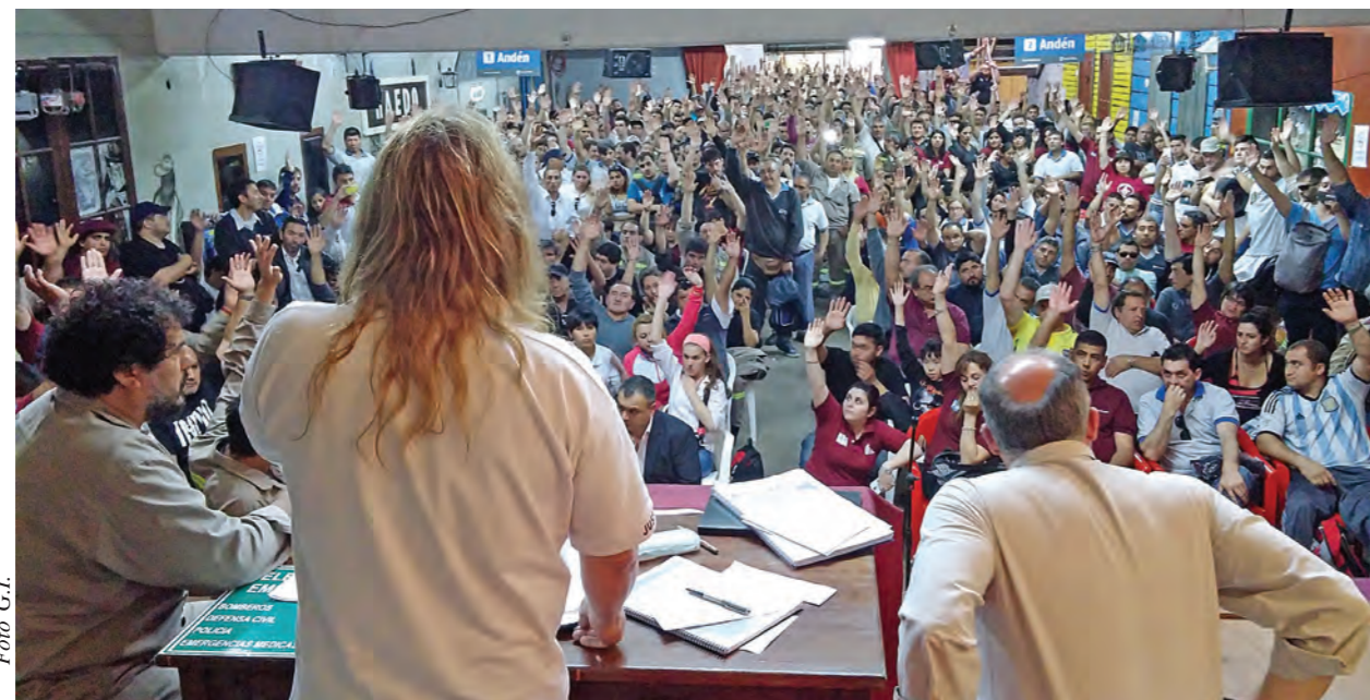
Más de mil ferroviarios votando el rechazo