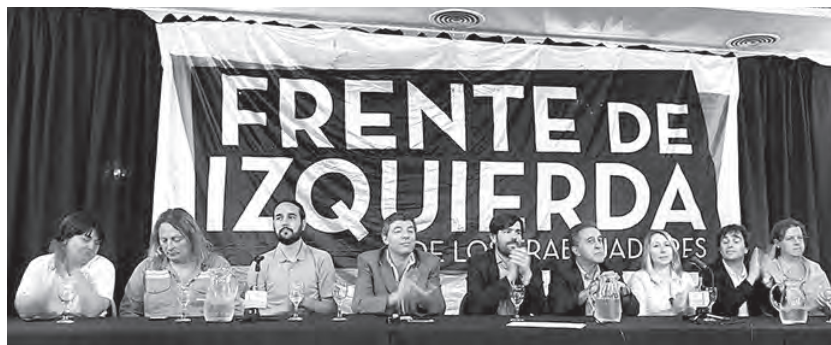
Conferencia de prensa del FIT llamando al voto en blanco o nulo realizada en el Hotel Castelar, 10 de noviembre. Ver declaración unitaria del Frente de Izquierda en www.izquierdasocialista.org.ar

tapada ("el peor de nosotros es mejor que cualquiera de la oligarquía", se justifican)-, deberían reflexionar sobre dos hechos.