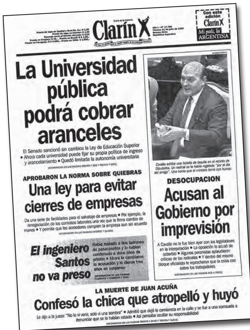
Durante 20 años de lucha el movimiento estudiantil frenó el arancelamiento de las universidades. Luego de 12 años de gobierno, el kirchnerismo busca apropiarse de esta conquista.

El Estado Nacional destina un 95% del presupuesto universitario a salarios (que son de miseria y con miles de docentes "ad honorem"), dejando la infraestructura y la investigación a cargo